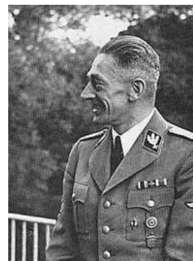
Karl Hermann Frank