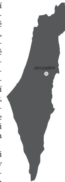
Stát Izrael po roce 1982

Po konfliktech v 80. letech byl v dalším desetiletí zahájen mírový proces, směřující ke vzniku palestinského státu. Ten sice přinesl řadu konkrétních výsledků, včetně ustavení palestinské správy, ale vytvoření dvou plnohodnotných a vzájemně se respektujících států se vždy zarazilo buď na ideovém nepřátelství, nebo na některém z konkrétních problémů, ať už to byl požadavek návratu palestinských uprchlíků na území Izraele, otázka existence židovských osad na palestinských územích, teroristické útoky či odlišné představy územního vymezení.