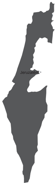
Stát Izrael 1949-1967

Moderní národní hnutí, jako jeden z klíčových modernizačních procesů 19. století, mělo ohlas i mezi evropskými Židy. Jejich situace však byla komplikovaná, neboť, na rozdíl od většiny ostatních moderních národů, neobývali kompaktní území, ale byli v minulosti donuceni žít rozptýleně. Proto se klíčovým tématem stala otázka asimilace, tedy zda splynout s většinovými národy a ponechat tak židovství na úrovni kulturní odlišnosti, či zda vytvořit plnohodnotný moderní židovský národ, včetně úsilí o naplnění jednoho z klíčových cílů moderních národů, totiž národního státu. Tato druhá možnost tvořila základ sionistického hnutí.